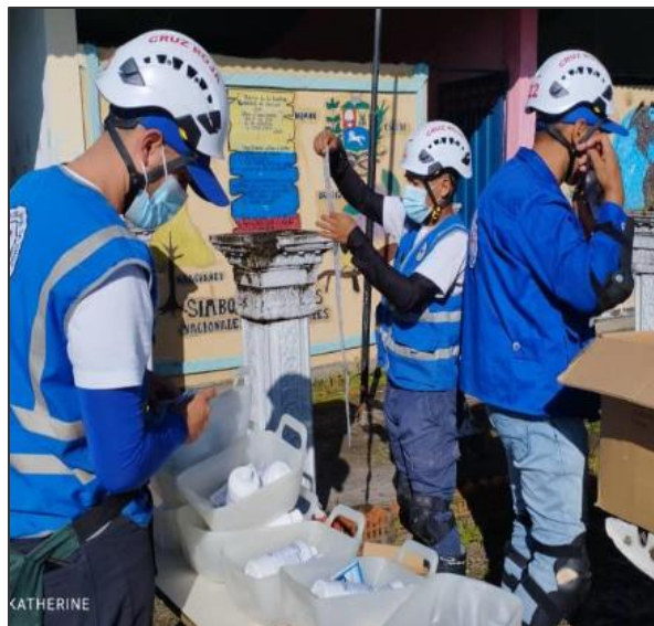
Entrega de kits de agua y saneamiento en el municipio Antonio José de Sucre como respuesta al desbordamiento del río Socopó.